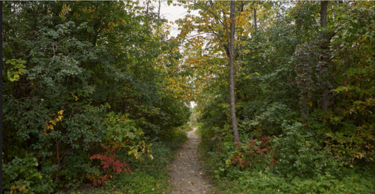
Nous avons demandé au photographe Simon Couturier de visiter quelques lieux évoqués dans King Dave et d’en ramener quelques clichés personnels. Découvrez sa série «Sur les traces de King Dave» dans le foyer du théâtre.