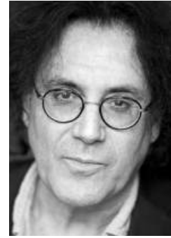
AUTEUR : ÉRIC ASSOUS

Originaire de la ville de Tunis et Français d'adoption, le prolifique auteur Éric Assous écrit autant pour le théâtre que pour le cinéma, signant notamment plus de 80 textes de radio-théâtre pour la chaîne France Inter. Outre cette énorme contribution, on doit à Assous de nombreuses pièces destinées à la scène, dont Les acteurs sont fatigués , Les Montagnes russes , Les Conjointes , Mon meilleur copain et L'illusion conjugale pour laquelle il récolte, en 2010, le Molière de l'auteur francophone vivant. Il a également signé la pièce Les Belles-Soeurs , présentée chez DUCEPPE en 2014 dans une adaptation de l'auteur Michel Tremblay... qui l'a renommée L'esprit de famille ! En septembre 2013, Éric Assous voit trois de ses pièces prendre l'affiche à Paris, dont Nos femmes