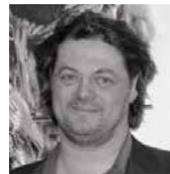
AUTEUR : GÉRALD SIBLEYRAS

Il s'agit d'un placement dont la valeur et le rendement fluctuent; le passé n'est pas indicatif du futur. Ces titres sont placés au moyen d'un prospectus contenant de l'information détaillée importante à leur sujet, notamment sur les frais. Avant d'investir, veuillez consulter le prospectus sur fondaction.com.