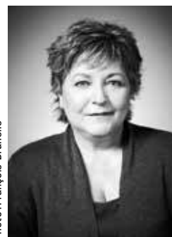
METTEUSE EN SCÈNE : MONIQUE DUCEPPE