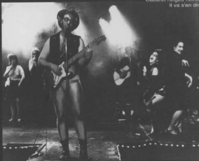
Cabaret neiges noires, Il va s'en dire

4012, rue Saint-Denis Coin Duluth tél.: 844-1919