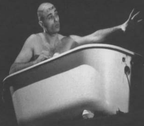
Helter Skelter, Momentum