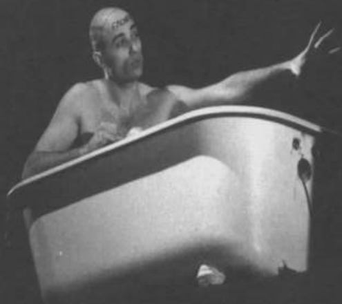
Helter Skelter, Momentum